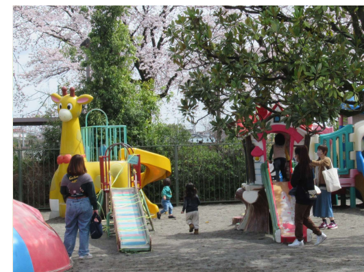
来月も一緒に遊みましょうね