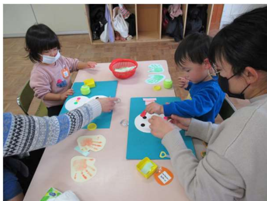
どんなお顔にしようかな～？