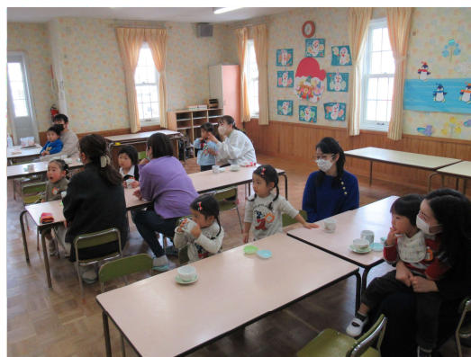
皆でおやつをいただきます