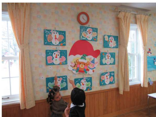
とっても上手にできました！