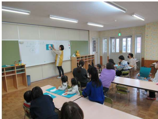
今日は雪だるまをつくります！